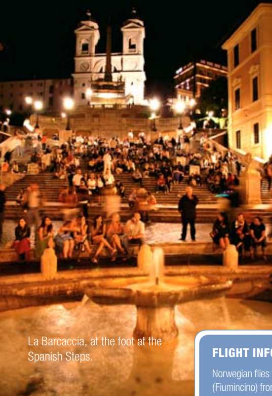
La Barcaccia, at the foot at the Spanish Steps.