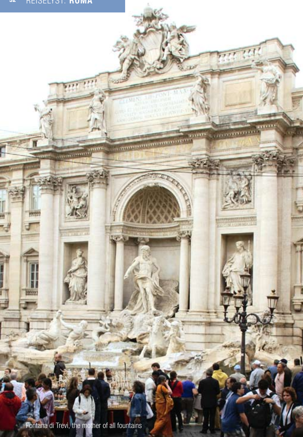
Fontana di Trevi, the mother of all fountains